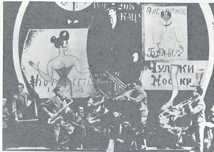
Сцена из «Музыкального магазина»

— Есть и не одна, даже точнее — не один десяток. Я вообще считаю, что исполнитель не должен записывать на пластинки буквально все, что он поет. Граммофонный диск мне представляется фиксацией лучшего, что есть в репертуаре певца или певицы. Но истинный отбор произведет время. С годами становится ясно, что одна песня, считавшаяся шлягером, тихо отходит в прошлое и вспоминается без удоволь-